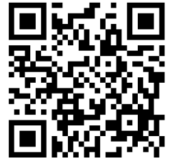
網路報名 QR Code